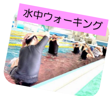
水中ウォーキング