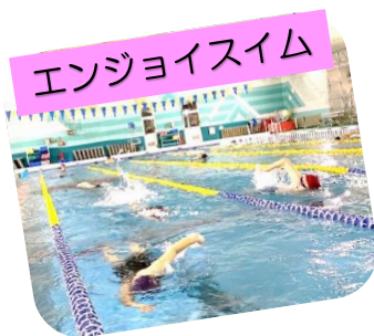
エンジョイスイム

10:10～ バラエティースイム 11:10～ 水中ウォーキング 13:45～ エンジョイスイム 45 18:30～ はじめてプール バラエティースイム