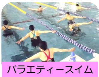
バラエティースイム